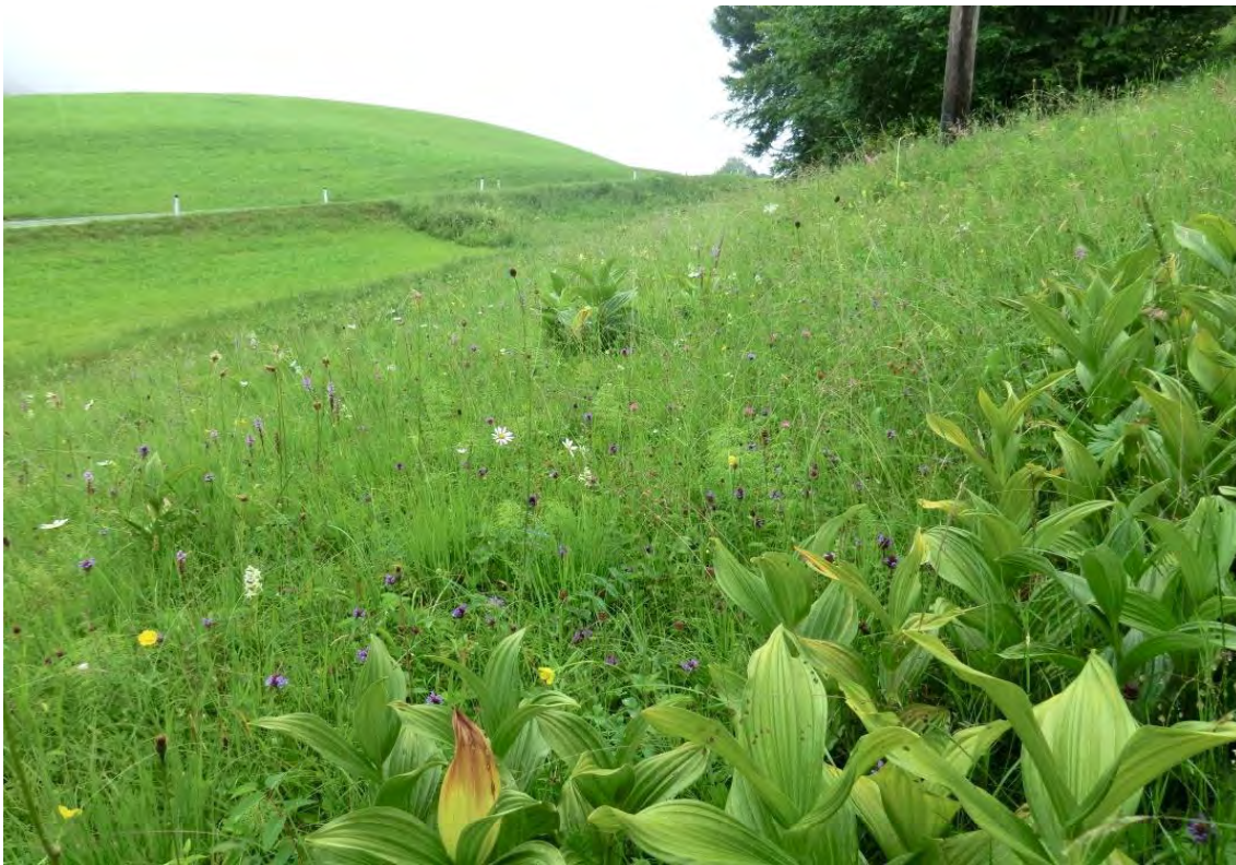
Pfeifengraswiese mit Weißem Germer und verschiedenen Orchideenarten.