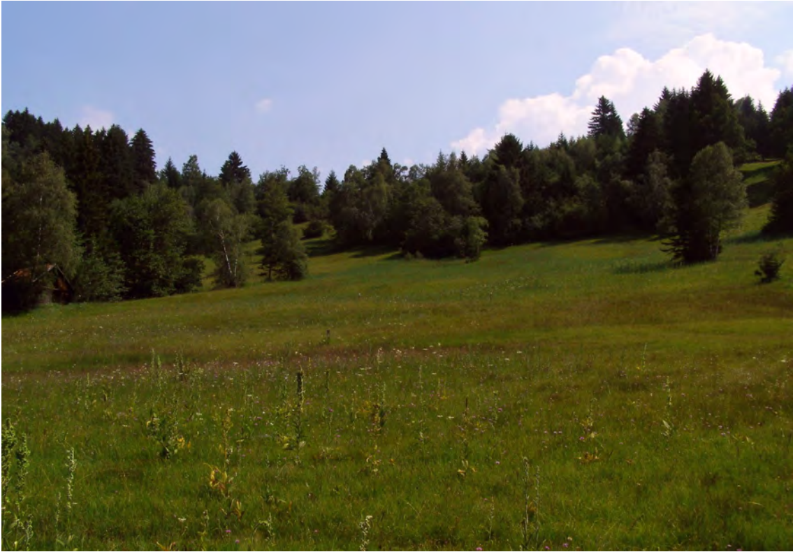
Hang- und Quellmoore im zentralen Bereich des Feuchtgebietskomplexes Wiesberg-Gröllerkopf.