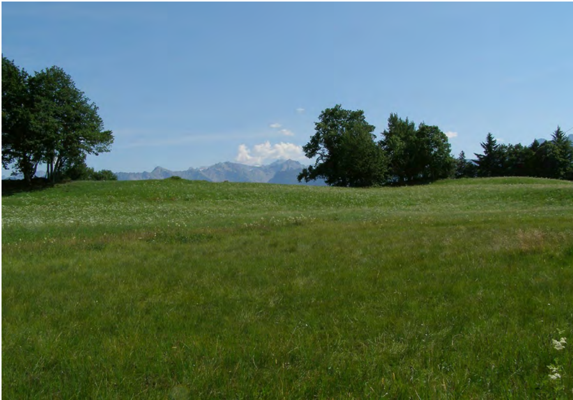
Das kleine torfmoosreiche Übergangsmoor westlich des Tubarieds.