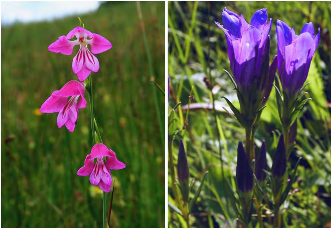
Die vom Aussterben bedrohte Sumpf-Gladiole ( Gladiolus palustris ), links, und der stark gefährdete Lungen-Enzian

Im Jahr 2006 konnte der Langblättrige Sonnentau ( Drosera anglica ) nicht wiedergefunden werden.