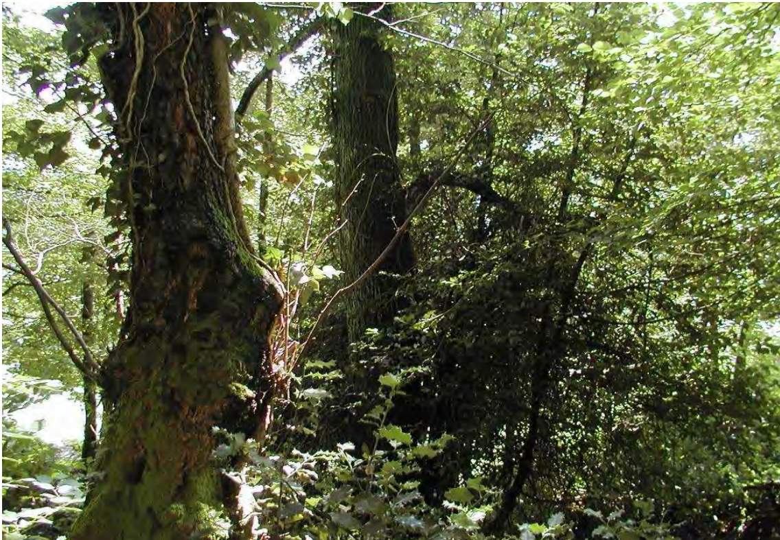
Efeumrankte Hainbuchen und Schwarzerlen in den Quellwaldresten bei Herzmoos. Im Vordergrund eine junge Stechpalme.

Kulturlandschaftskomplex aus mageren Weiden, Hecken, Einzelbäumen und Quellwald-fragmenten oberhalb von Herzenmoos. Das Quellgebiet (Fahlbrunnen, Frauenbrünnele, Brünneledola), zeichnet sich nicht nur durch besondere Schwarzerlenwaldfragmente und -einzelexemplare aus, sondern ist auch landschaftlich sehr reizvoll und abwechslungsreich. Die Erlenbestände sind hier durchwegs sehr klein, die floristische Zusammensetzung wird durch die enge Verzahnung mit Saumgesellschaften und dem Wirtschaftsgrünland beeinflusst. Bemerkenswert sind teils sehr alte baumförmige Stechlaub-Individuen und alte Eiben in den feucht-warmen Waldfragmenten. Es handelt sich um einen sehr seltenen Biototyp bzw. um eine durch spezifische Naturelemente geprägte Kulturlandschaft.