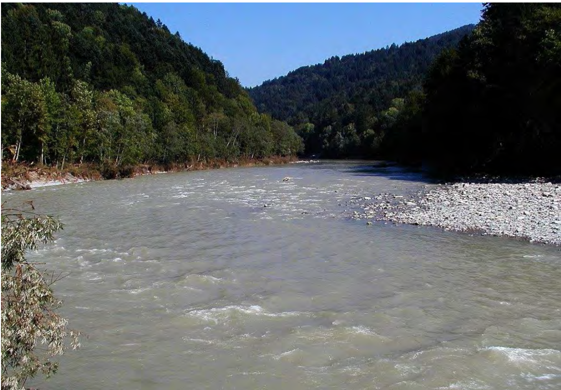
Die Bregenzerache mit den umgebenden buchendominierten Hangwäldern.

Der Bestand bildet zusammen mit den Biotopen Wolfurt 24012, Buch 20802, Bregenz 20715, Langen 22210, Alberschwende 20114 und Doren den Biotopkomplex und das Natura-2000 Gebiet "Bregenzerachschlucht".