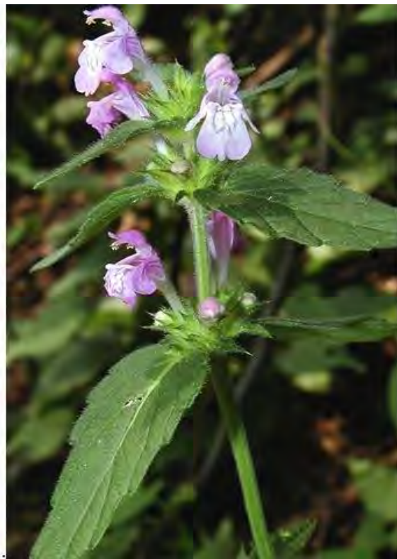
Nagelfluhblöcke mit umgebenden Baumbewuchs und der in Vorarlberg stark gefährdete Flaum-Hohlzahn ( Galeopsis pubescens ).