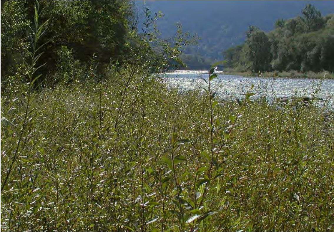
Dichte Pionierweidengebüsche säumen die Ufer der Bregenzerache in den Kennelbacher Achauen.