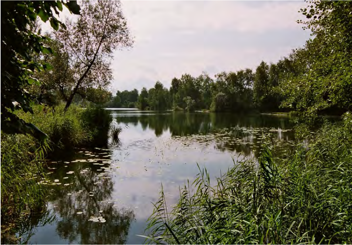
Sehr naturnah ausgebildeter Baggersee mit Teichrosen, Verlandungsröhricht und Galeriewäldern.