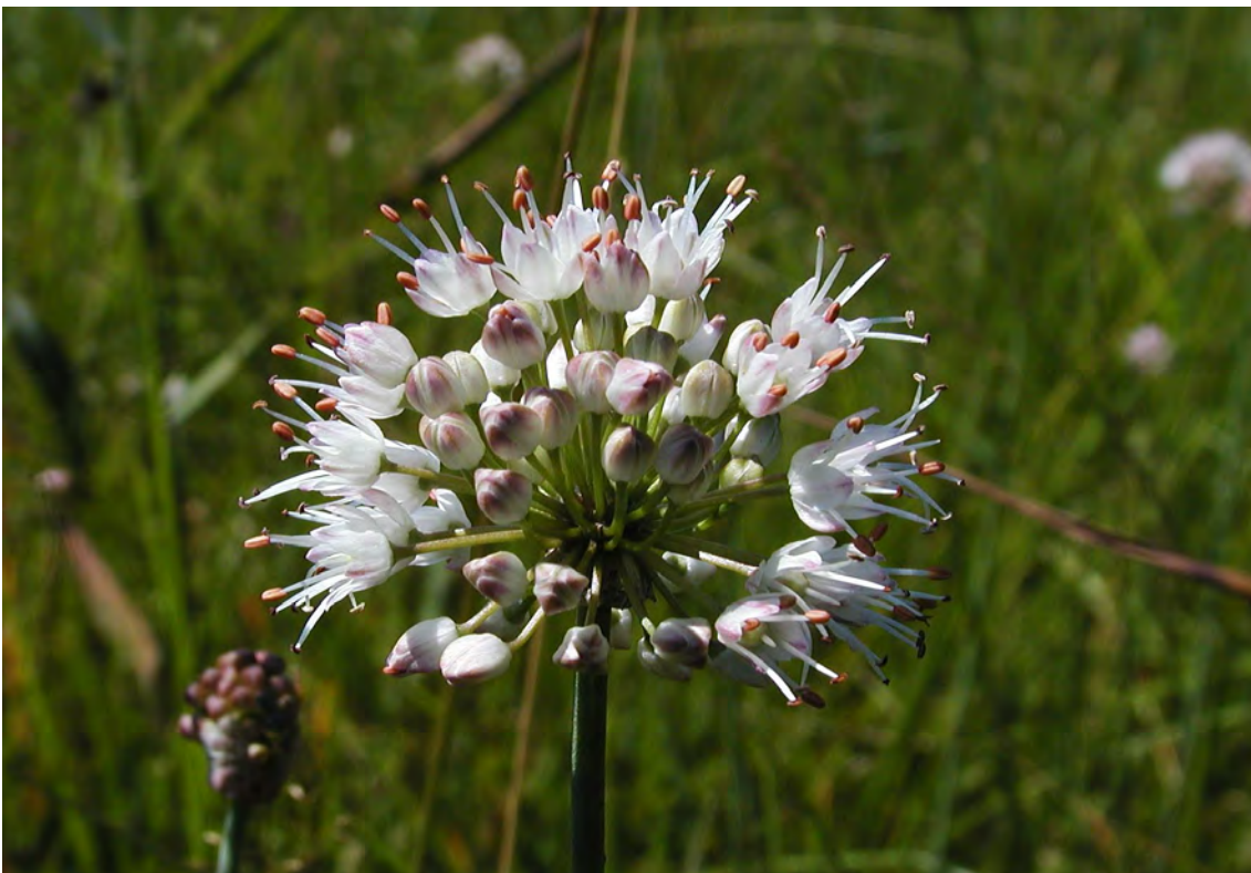
Der vom Aussterben bedrohte Duftlauch ( Allium suaveolens ), eine charakteristische Art der Streuwiesen im Rheintal.

Ihre Großflächigkeit verleiht den Streuflächen eine besondere ornithologische Bedeutung. Insbesondere brüten hier Uferschnepfe, Braunkehlchen und Schafstelze.