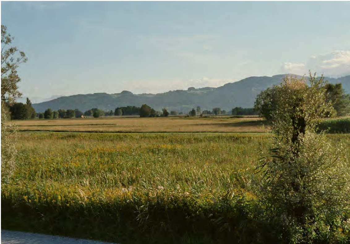
Blick vom Damm Richtung Westen (Im Gebiet von Rohr).