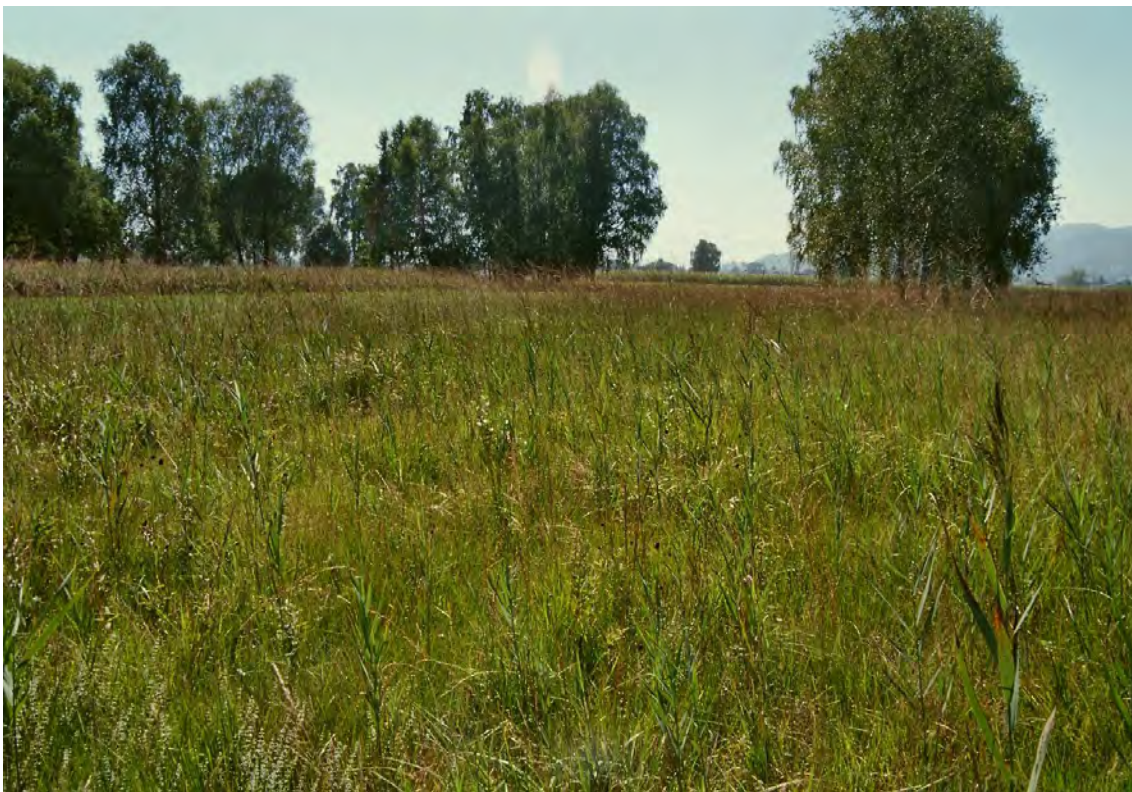
Niederwüchsige, mäßig verschilfte Pfeifengras-Streuwiesen mit schöner Birkenbestockung.

Es handelt sich bei diesem Biotop um eine große Anzahl schmaler Pfeifengraswiesen- Parzellen an der nordöstlichen Gemeindegrenze von Höchst zu Fußach. Die Flächen liegen zwischen Fettwiesen und verbuschten Parzellen und gehen lokal in Hochstaudenrieder über. Der Großteil der Flächen wird von trockenen Pfeifengraswiesen eingenommen, die zu einem kleinen Teil verbrachen. Dazwischen sind auch feuchtere Streuflächen, sowohl in basischer als in kleinen Teilen auch in saurer Ausprägung, vorhanden. Der Riedcharakter wird unter anderem auch durch die schönen Birken ( Betula pendula ) in Einzelbestockung unterstrichen. Die Streuwiesen wachsen über Gleyen aus feinem Schwemmmaterial, die teilweise Torfeinlagerungen aufweisen. Lokal sind Niedermoortorfe über Schwemmmaterial zu finden.