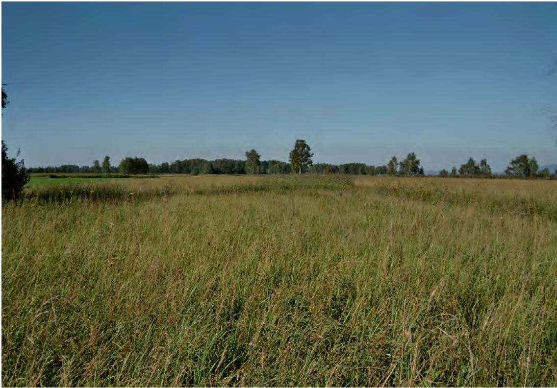
Basenreiche Pfeifengraswiese (Selino- Molinietum caeruleae) mit zahlreichen bemerkenswerten Arten wie Duft- Lauch ( Allium suaveolens ) und Sommer-Drehähre ( Spiranthes aestivalis ).