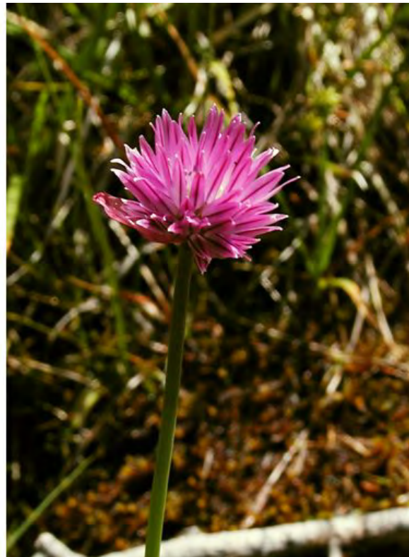
Die beiden vom Aussterben bedrohten Arten Sommer-Drehähre ( Spiranthes aestivalis ) links und der Wilde Schnittlauch ( Allium schoenoprasum ) rechts.