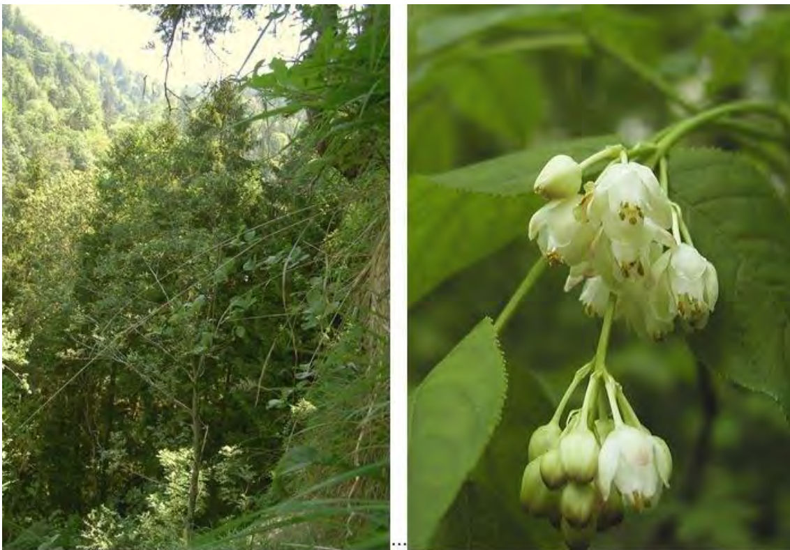
Die wärmeliebenden Wälder des Ruggbergs mit ihrer artenreichen Strauchschicht. Rechts die seltene Pimpernuss ( Staphylea pinnata ). Links Blick vom Föhren-Steilhangwald in die Schlucht des Lotenbaches unterhalb Lutzenreute.

Streuwiesen sind im Bereich der Obersenne, der Weingärtlein und noch auf einigen kleineren Lichtungen zu finden (z.B. Eschers Wiesele), wobei die Wiesen mit Ausnahme der Obersenne und des Oberen Weingärtleins aufgrund der fehlenden Nutzung gegenwärtig bereits stark verbuscht sind. An den feuchtesten Stellen sind besonders im Gebiet der Obersenne Davallseggenrieder ( Caricetum davallianae ) ausgebildet, ansonsten herrschen Niedere und Hohe Pfeifengraswiesen ( Molinietum caeruleae , Cirsietum rivularis s.l.) vor. An einigen Stellen dominiert die Mädesüß-Hochstaudenflur ( Filipenduletum ). Insgesamt sind die Streuwiesen außerordentlich artenreich und beherbergen eine Reihe seltener und teils stark gefährdeter Arten. Um Felsblöcke und einzelne Bäume sind Gebüschmäntel mit Schlehdorn ( Prunus spinosa ), Hasel ( Corylus avellana ), Rotem Hartriegel ( Cornus sanguinea ) und anderen Straucharten aufgewachsen.