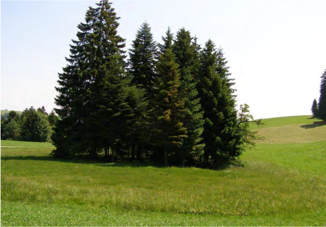
21205 1: Moor mit Zwischenmoorcharakter unter Gschwend.