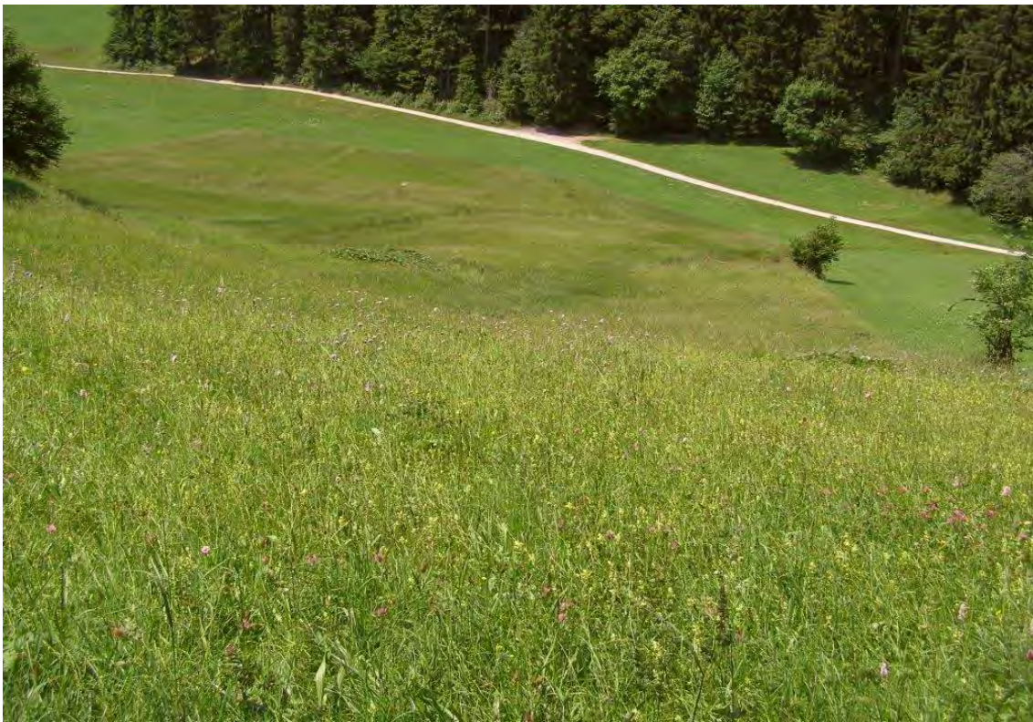
Magere Goldhaferwiesen und Hangmoore an den Abhängen östlich Lutzenreute.