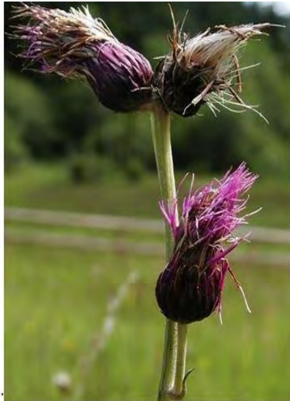
21205 3: Das Moor zwischen Jungholz und Hirschberg beherbergt die beiden in Vorarlberg stark gefährdeten Arten Frühlingsknotenblume ( Leucojum vernum ), links und Bach-Kratzdistel ( Cirsium rivulare ), rechts.