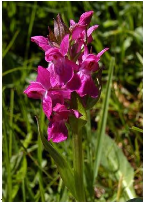
21205 2: Die beiden für Flachmoore typischen Orchideenarten Sumpf-Stendelwurz ( Epipactis palustris ) links und Breitblättriges Fingerknabenkraut ( Dactylorhiza majalis ) rechts, treten im Moor bei Trögen auf.