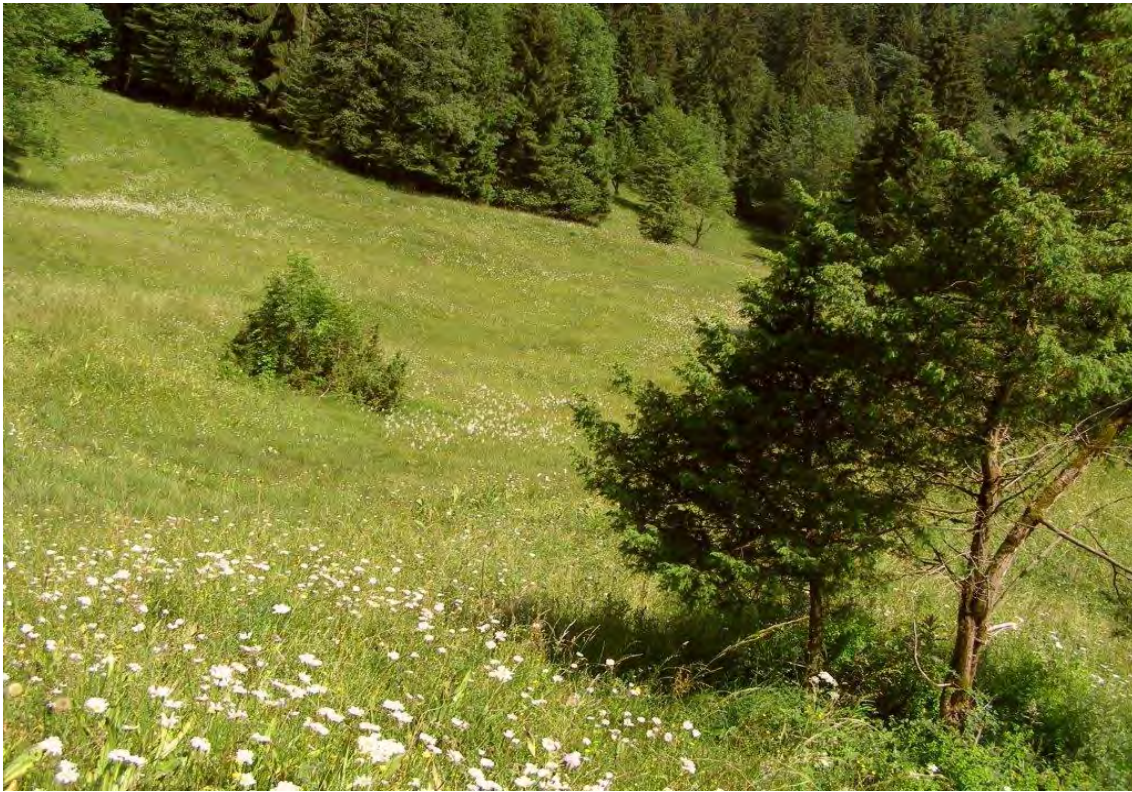
Blick über den südwestlichen Teil der Hangflachmoor unterhalb der Trägerhöhe; im Vordergrund Wacholdersträucher.