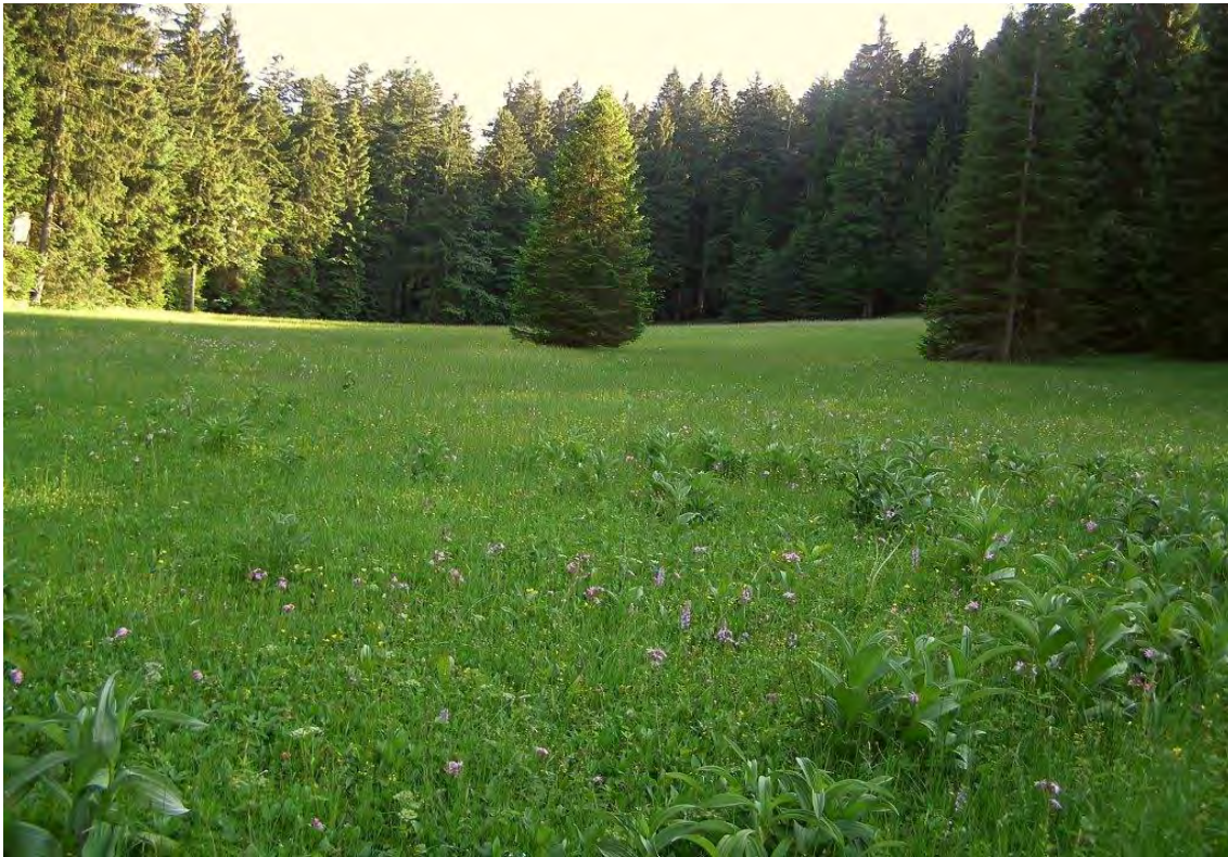
Saure Pfeifengraswiesen, Braunseggenmoore und Zwischenmoore mit Draht-Segge im Bereich einer Hangverebnung bei Hub.