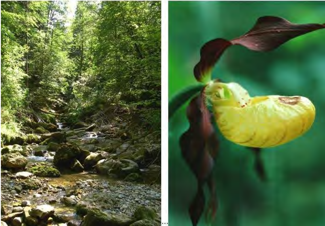
Blick in die Kesselbachschlucht bachaufwärts unterhalb Ochsenhorn; rechts der in lichten Wäldern vorkommende Frauenschuh ( Cypripedium calceolus ).