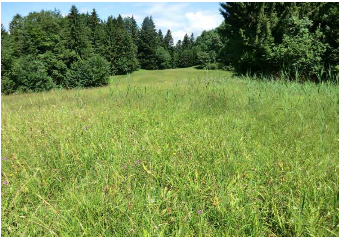
Blick über die Feuchtwiesen der Waldlichtung nach Norden.

Waldlichtung am Hang beim Hof Stegen mit einer wechselfeuchten Bergwiese und kleineren Flachmoorbereichen, die den Ursprung kleiner Bächlein bilden. Die zentralen wechselfeuchten Bergwiesen weisen viel Honiggras und Wiesen-Flockenblume auf. Die Lichtung ist buckelig, in den Mulden im Randbereich liegen mehrere kleinflächige Kleinseggenriede, stellenweise wachsen auch Fluren der Nährstoff liebenden Graugrünen Binse. Entlang des östlichen Waldrandes verläuft ein stark verschliffener Wiesenstreifen. Die kleinsträumig wechselnden Standortverhältnisse auf dieser Waldlichtung haben zu einer engen Verzahnung von verschiedenen Wiesenvegetationstypen geführt, die insgesamt recht artenreich sind und eine Reihe an gefährdeten Pflanzenarten aufweisen.